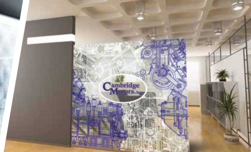
RÓTULOS PARA ESCAPARATES