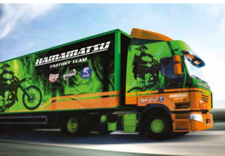
RÓTULOS PARA VEHÍCULOS