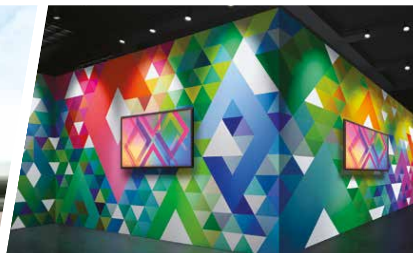
ELEMENTOS GRÁFICOS PARA EXPOSICIONES