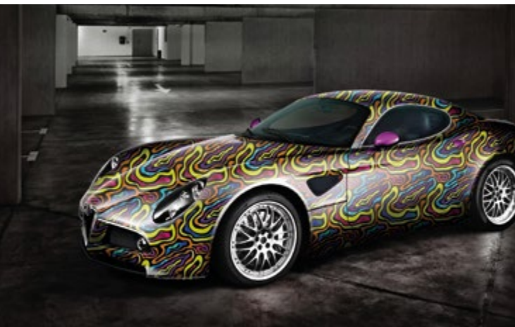
RÓTULOS PARA VEHÍCULOS