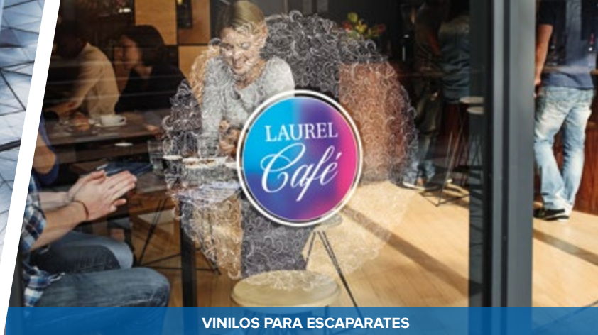
VINILOS PARA ESCAPARATES