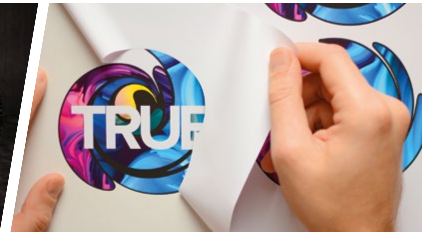
ETIQUETAS Y ADHESIVOS TROQUELADOS