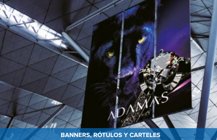
BANNERS, RÓTULOS Y CARTELES